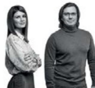
Автор проекта Елена Перегудова, руководитель проекта Алексей Агольцов